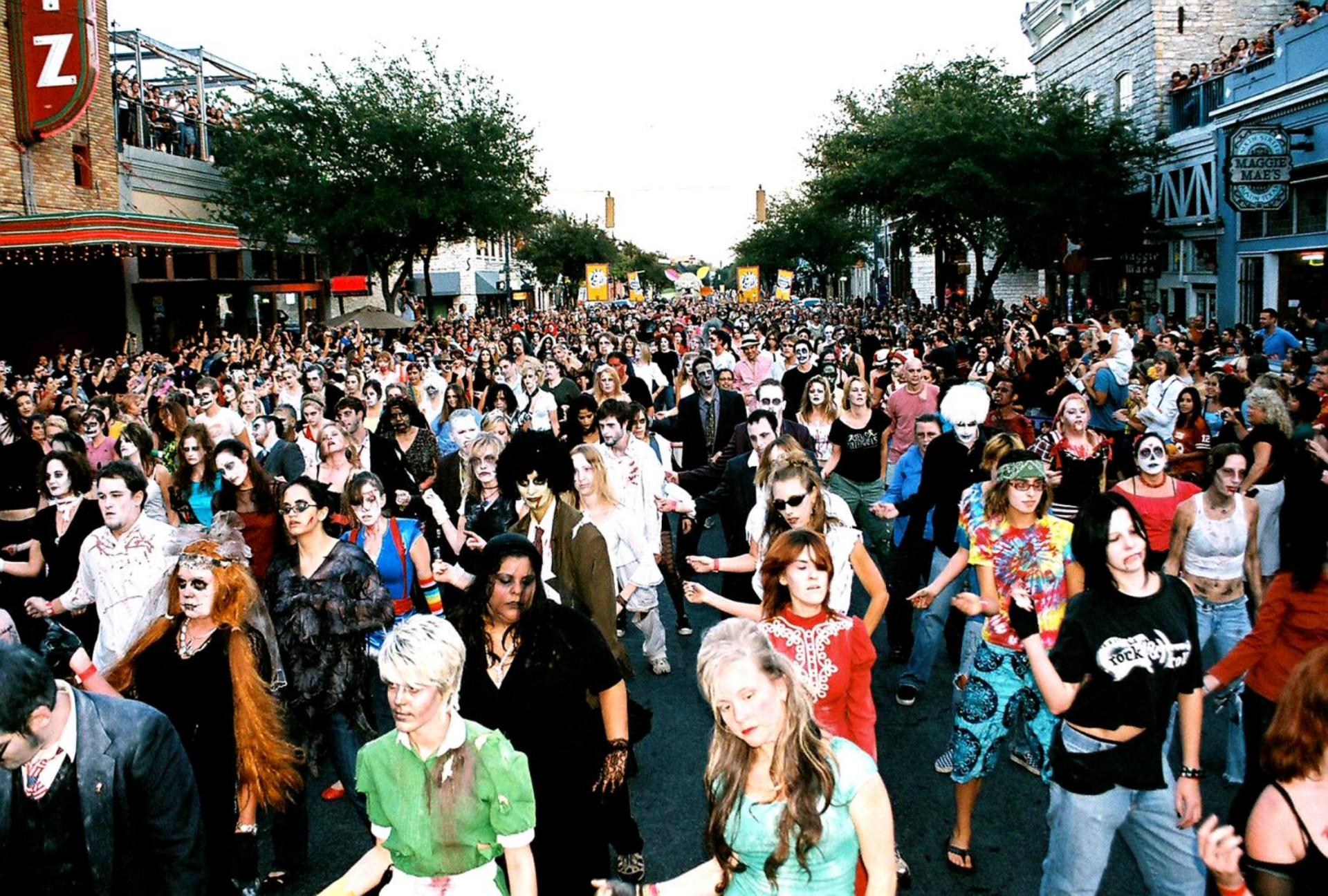
DIA DE LOS MUERTOS / VIVA LA VIDA FEST